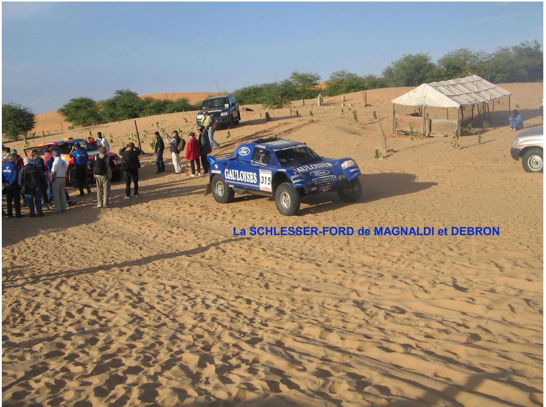
La SCHLESSER-FORD de MAGNALDI et DEBRON